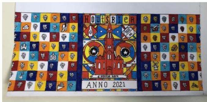
Etiketontwerp voor de Houtse Quadrippel

Veel Houtenaren zijn met hun eigen expertises aan de slag om 'specials' te ontwerpen voor de verkoop om de restauratie van het vieringtorentje (het kleine torentje achteraan op het dak-red.) te kunnen bekostigen. Een tipje