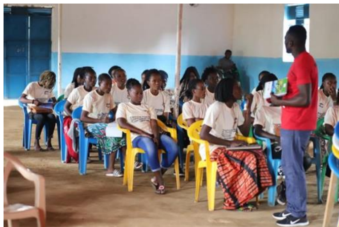
Jongeren in het Nakivale Refugee Settlement

Het is landelijk al een jarenlang gebruik om in de vastentijd (die tot pasen duurt) geld in te zamelen voor een goed doel ergens op de wereld. Op lokaal niveau wil de Catharinaparochie geld ophalen voor het Project Nakivale Refugee Settlement (een vluchtelingenkamp) in Uganda. Daar zijn veel mensen vanuit omringende landen naartoe gevlucht. Ze wonen er in kampen. Enkele van deze gezinnen zijn in 2018 naar Oosterhout gekomen. Ze hebben hier een nieuw leven opgebouwd. De Catharinaparochie uit Oosterhout heeft een goed contact met deze gezinnen en ze heeft de afgelopen jaar de achterblijvers in Uganda al gesteund met sportkleding, zodat de jongeren kunnen ontspannen.