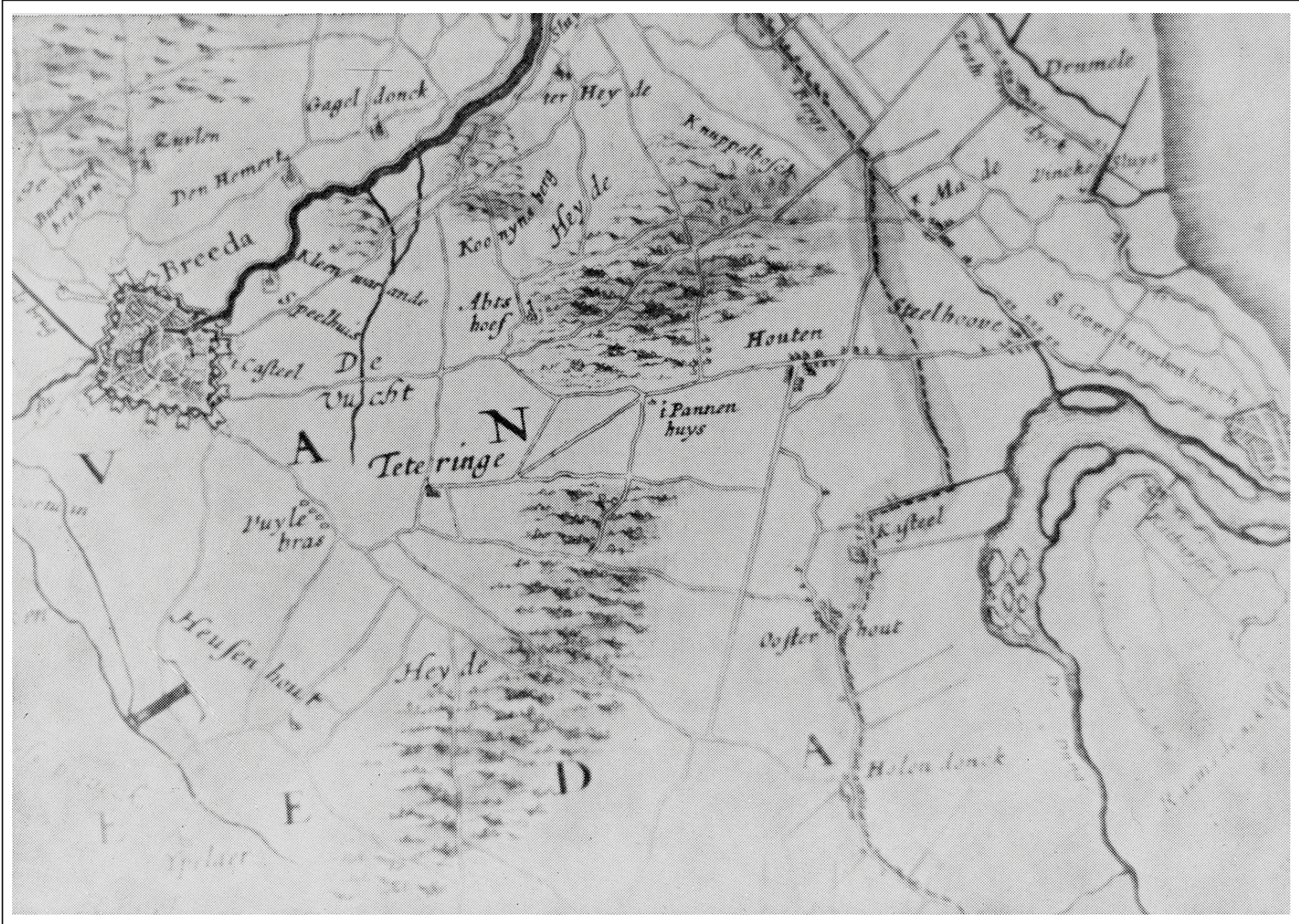
Kaart 2 Situering in het jaar 1629