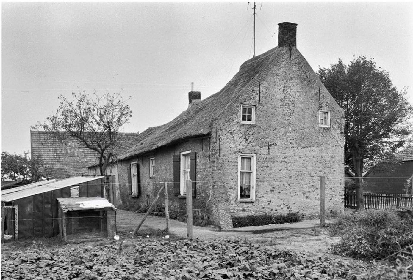
Foto: Verdwenen boerderij aan de Vrachelsestraat

In de rubriek 'Uit de oude doos' publiceert het dorpsblad elke maand een foto van 'vroeger'. Deze maand een foto uit 1966 van een authentieke boerderij in Vrachelen die plaats moest maken voor de vernieuwde aansluiting van het Markkanaal op het Wilhelminakanaal.